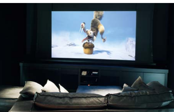
MIGLIORE SALA CINEMA Avantgarde Audio Video Automation HC 53