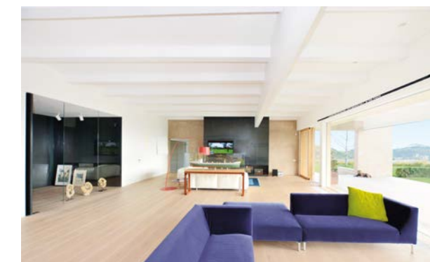
AUTOMAZIONE AVANZATA Intac HC 65