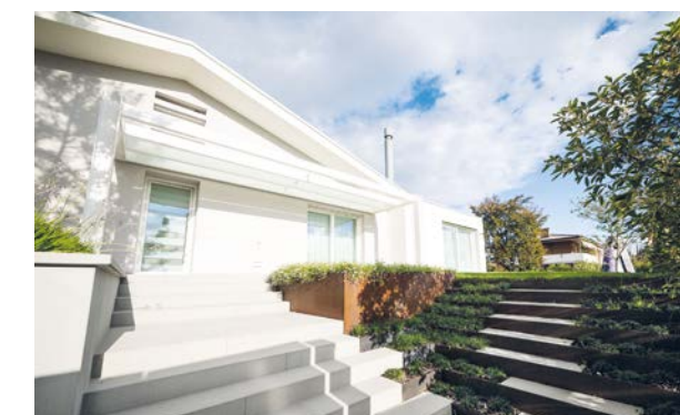
RISPARMIO ENERGETICO Amadeus Network Solution HC 65