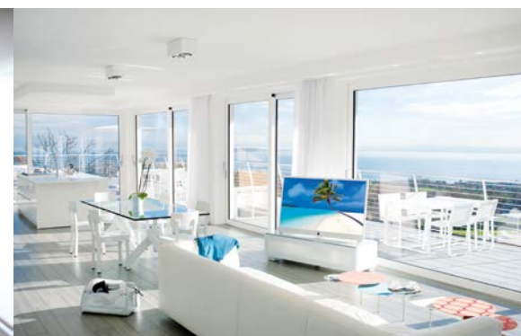
MIGLIOR SISTEMA RESIDENZIALE DI LUSO Prestige Living HC 62