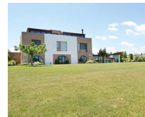
MIGLIOR SISTEMA "USER FRIENDLY" Di Prinziò Top Class HC 63