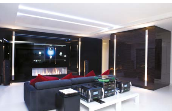
MIGLIORE PERSONALIZZAZIONE Advance Living Solutions HC 55