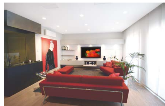
MIGLIOR INTEGRAZIONE <200MQ Audiotime HC 57