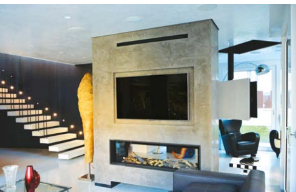
MIGLIOR INTEGRAZIONE >200MQ Giacca Srl Costruzioni Elettriche HC 52